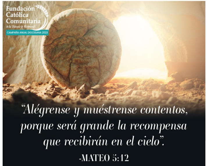
Domingo de la Resurrección del Señor

We are a people of hope because of today, the day God conquered death. There is no thought more preposterous or delightful than God becoming man, dying, and conquering death for us because we are given hope through his blood.